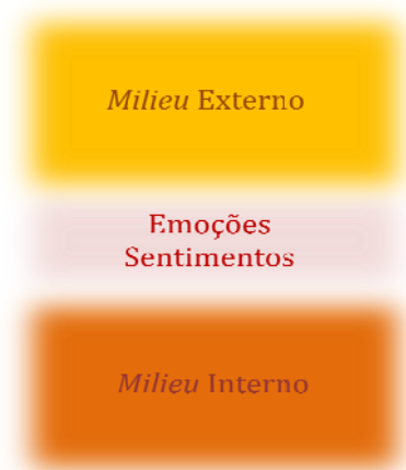
Figura 1 – Emoções e sentimentos na fronteira entre o milieu interno e o milieu externo

Nesta linha de pensamento, na tipologia enunciada por aquele autor, na qual distingue entre emoções primárias, secundárias (ou sociais) e de fundo, diria que não são apenas as emoções secundárias ou sociais que são sociais, as emoções primárias e de fundo, ou pelo menos os sentimentos que podem originar, são também iminentemente sociais, pois a sua expressão (vivência) é mediada do outro social, como certamente anuiriam Erikson (1972), Mead nas palavras de Blumer (1982). Aliás, todas as emoções são manifestações ontológicas, logo, inscrevem-se na relação do indivíduo (neste caso humano) com os “outros” seus semelhantes. Alguns exemplos para que se perceba melhor: (1) o medo do escuro pode ser minimizado pela presença de outra pessoa que transmita segurança; (2) num velório a tristeza pode ser induzida (intensificada) pela presença das carpideiras; (3) os níveis de calma ou de tensão podem ser influenciados pela ação de terceiros através dos bem conhecidos efeitos de grupo ou de massas. 1